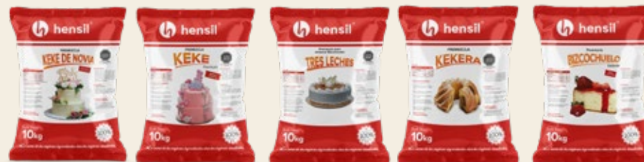
Línea de Premezclas

Información legal y datos de contacto ubicados en la parte posterior para mantener limpieza visual en el frente.