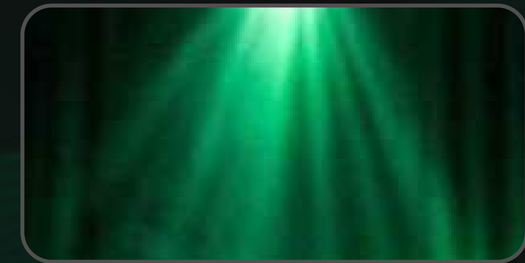
Detalles de iluminación