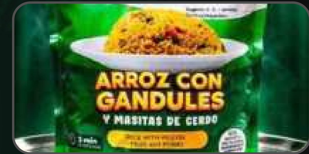
Foco en el producto