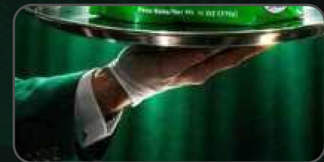
Concepto de servicio